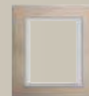
Τιτάνιο Αρ.κατάλ. 1003 76