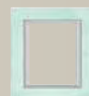
Κρύσταλλο Αρ.κατάλ. 1003 74