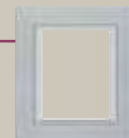
Αλουμίνιο Αρ.κατάλ. 1003 73