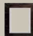
Wenge Αρ.κατάλ. 1003 75